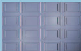
Type de panneau "DECO"